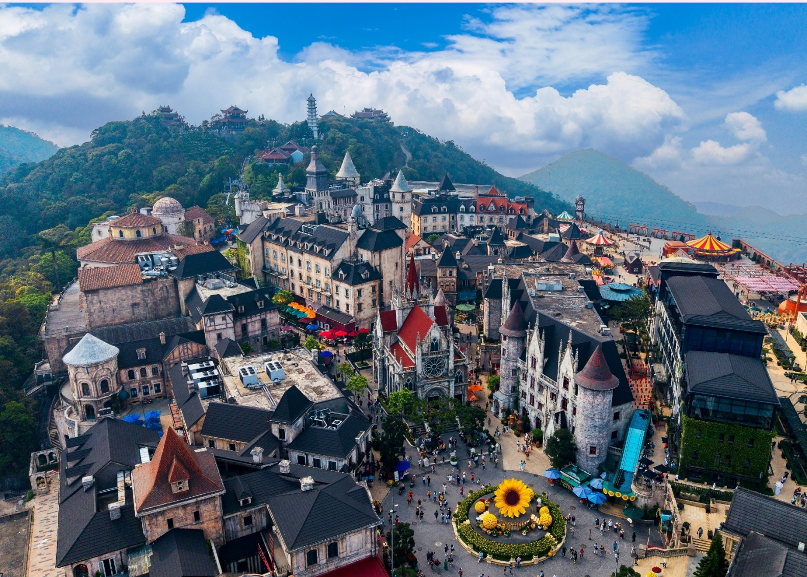
ยังยอดเขา

นำท่านนั่งกระเช้าขึ้นสู่เมืองตากลากาศขึ้นชื่อแห่งเมืองดานัง บานาฮิลล์ (Bana Hills) บานาฮิลล์เป็นแหล่งท่องเที่ยวตากลากาศมาตั้งแต่สมัยสงครามโลกครั้งที่ 1 โดยเกิดแนวคิดการสร้างบ้านพักและโรงแรมจากชาวฝรั่งเศสสมัยอาณานิคมตั้งแต่ปี 1919 หลังจากจบสงครามฝรั่งเศสได้พ่ายแพ้และเดินทางออกจากเวียดนามเพื่อกลับประเทศ ทำให้บานาฮิลล์ถูกทิ้งร้างมาเป็นเวลานาน รัฐบาลเวียดนามได้บูรณะเป็นเมืองท่องเที่ยวตากลากาศแห่งนี้อีกครั้งในปี 2009 พร้อมกับได้มีการสร้าง กระเช้าลอยฟ้าเพื่อใช้เป็นเส้นทางสำหรับขึ้นไป