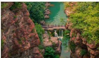
อุทยานสวรรค์หยุนโกซาน