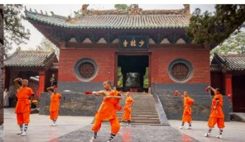
ชมโชว์กังฟูเล่าหลิน

*ทางบริษัทฯ ขอสงวนสิทธิ์ในการสลับโปรแกรมทัวร์ตามความเหมาะสมขึ้นอยู่กับสถานการณ์หน้างาน โดยคำนึงถึงผลประโยชน์ของลูกค้าเป็นสำคัญ