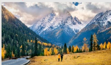
ภูเขาสี่ดรุณี (หุบเขาชวงเฉียวโก)