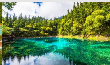
อุทยานแห่งชาติจิวจ้ายโก