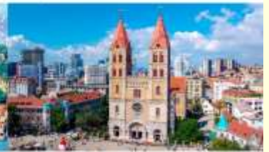
โบสถ์คริสต์เซนต์โมเคิล

*ทางบริษัทฯ ขอสงวนสิทธิ์ในการสลับโปรแกรมทัวร์ตามความเหมาะสมขึ้นอยู่กับสถานการณ์หน้างาน โดยคำนึงถึงผลประโยชน์ของลูกค้าเป็นสำคัญ