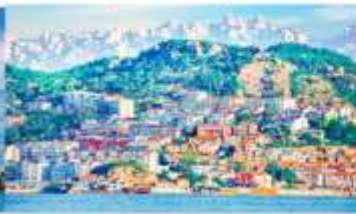
หมู่บ้านชาวประมงชาจื่อโข่ว