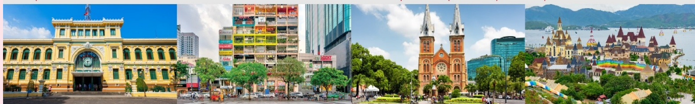
ไพรบ์นีย์กลางโฮจิมินห์