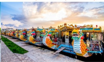
ล่องเรือมังกร