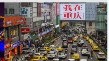
กวนอิมเจียว

*ทางบริษัทฯ ขอสงวนสิทธิ์ในการสลับโปรแกรมทัวร์ตามความเหมาะสมขึ้นอยู่กับสถานการณ์หน้างาน โดยคำนึงถึงผลประโยชน์ของลูกค้าเป็นสำคัญ