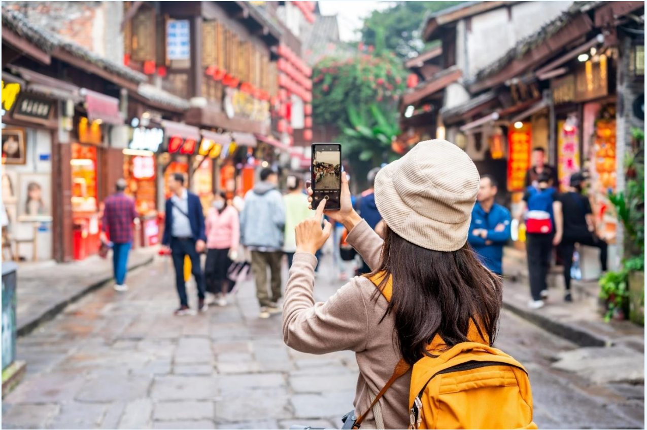
กลางวัน บริการอาหารกลางวัน ณ ภัตตาคารอาหารพื้นเมือง

จากนั้นนำท่านเดินทางสู่ หมู่บ้านโบราณฉือโข่ว (Ciqikou Ancient Town) เป็นหมู่บ้านอนุรักษ์ทางวัฒนธรรม และเป็นสถานที่ท่องเที่ยวชื่อดังของมหานครฉงชิ่ง ลักษณะก็คล้ายๆ กับตลาดเก่าหรือตลาดโบราณบ้านเรา สำหรับคนที่อยากไปย้อนเวลากลับไปในอดีตก็ต้องไปเยือน เพราะที่นี่ยังคงรักษาวิถีชีวิต รวมทั้งสะท้อนรากเหง้าดั้งเดิมของเมืองไว้ได้อย่างดีเยี่ยม ไม่ว่าจะเป็นตึกgramบ้านช่องที่มีรูปทรงโบราณ แหล่งผลิตสินค้า และอาหารพื้นเมืองที่สืบทอดกิจการต่อกันมาหลายรุ่น