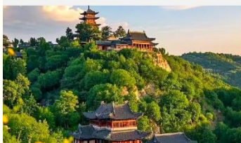
เขาเหย้าหวังซาน