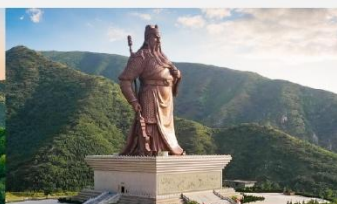
บ้านเกิดท่านกวนจู