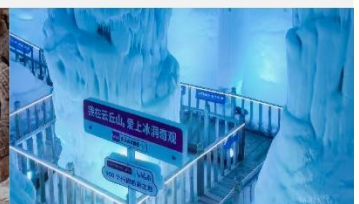
ถ้ำน้ำแข็งอ้วนซิวซาน

*ทางบริษัทฯ ขอสงวนสิทธิ์ในการสลับโปรแกรมทัวร์ตามความเหมาะสมขึ้นอยู่กับสถานการณ์หน้างาน โดยคำนึงถึงผลประโยชน์ของลูกค้าเป็นสำคัญ