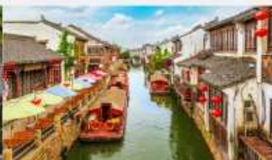
ถนนโบราณซานตงเจีย