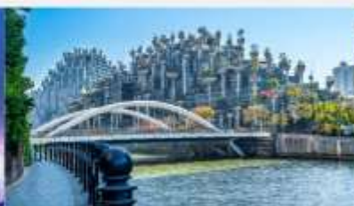
TIAN AN 1000 TREES