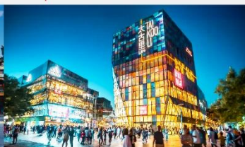
ย่านชุนหลี่ถุน

*ทางบริษัทฯ ขอสงวนสิทธิ์ในการสลับโปรแกรมทัวร์ตามความเหมาะสมขึ้นอยู่กับสถานการณ์หน้างาน โดยคำนึงถึงผลประโยชน์ของลูกค้าเป็นสำคัญ