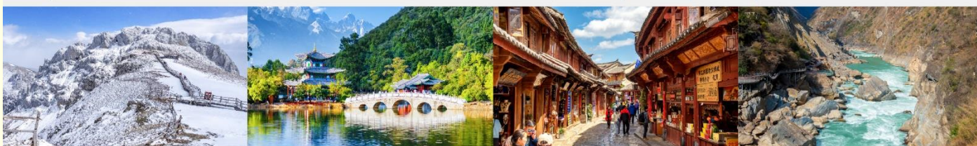
ภูเขาหิมะสี่ขา