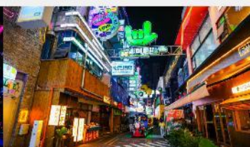
ถนนคนเดินซิงหยุน