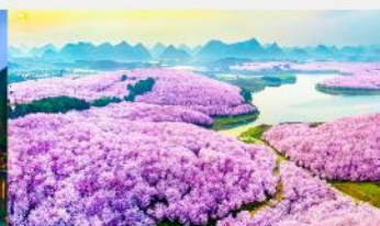
ซากระฝิงป้า