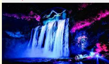
อุทยานน้ำตกหวงกั๋วซู่