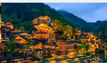
หมู่บ้านโบราณวูเจียงจ้าย