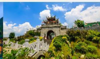
เมืองโบราณซิงเหยียน