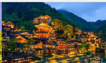
หมู่บ้านโบราณฉูเจียงจ้าย