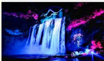
อุทยานน้ำตกหวงกั๋วซู่