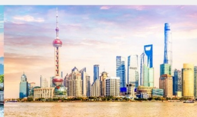
หาดไว่ถาน