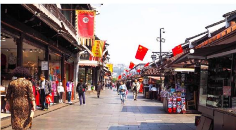
ถนนโบราณเหอฟางเจีย