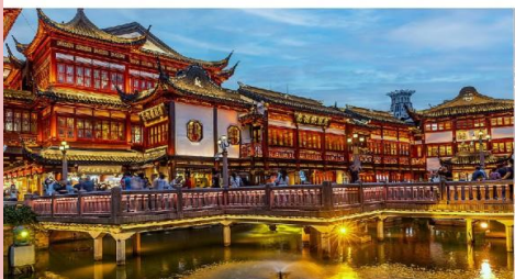
ตลาดร้อยปีเงินหวางเมี่ยว