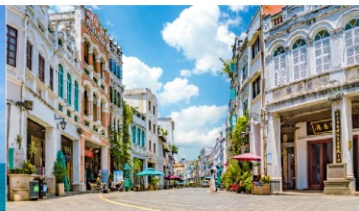
ถนนโบราณฉีไหลว