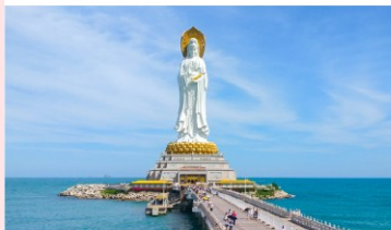
เจ้าแม่กวนอิมหนานซาน