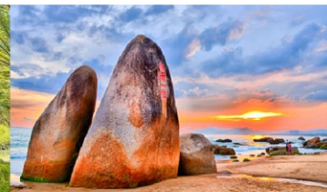
วนอุทยานสุดขอบฟ้า