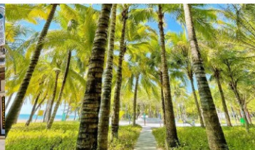
ทางเดินมะพร้าว