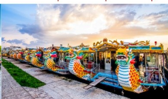
ล่องเรือมังกร